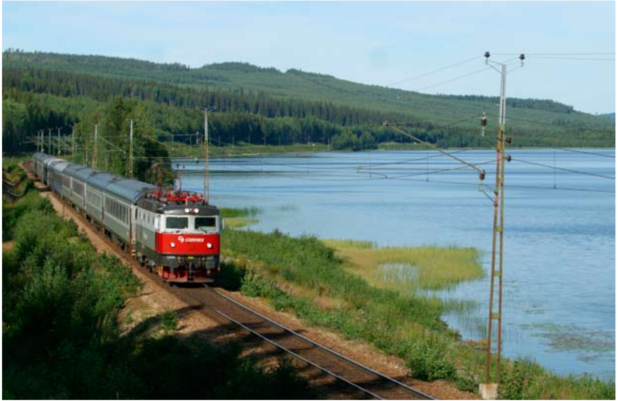
Tåg 92 passerar Stugsjön klockan 9:31 den 15 augusti