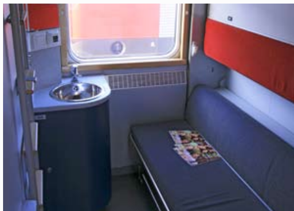
Kupé i upprustad sovvagn 2-klass med 3 bäddar per kupé och dusch i korridor (littera WL6)

Utmaningen som Statens järnvägar nu står inför är att tillsammans med operatören kontinuerligt arbeta med att hålla vagnarna i gott skick. Detta kräver ett långsiktigt arbete i hela avtalskedjan, från Statens järnvägar till underhållsleverantörer.