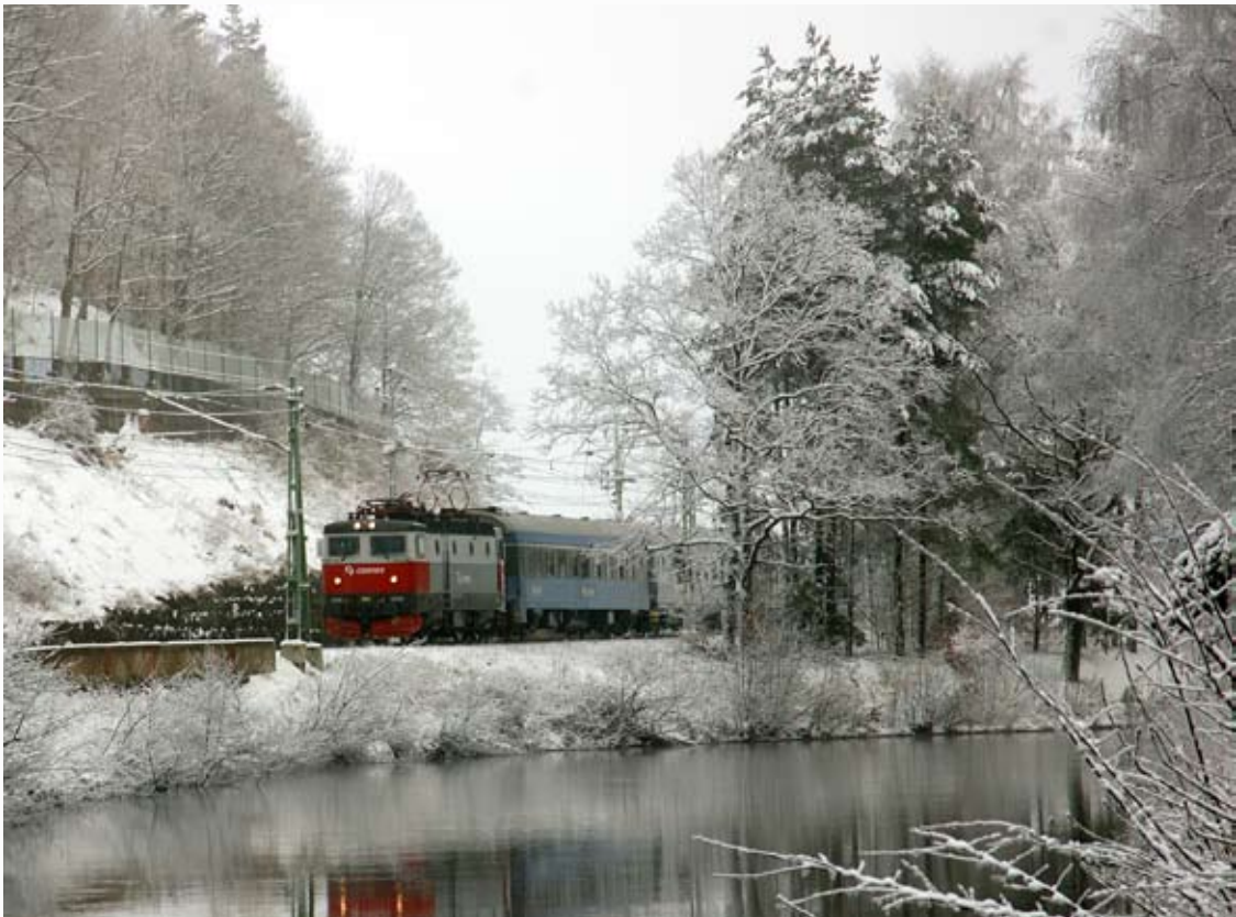
Nattåget mellan Göteborg och Narvik i närheten av Jonsered