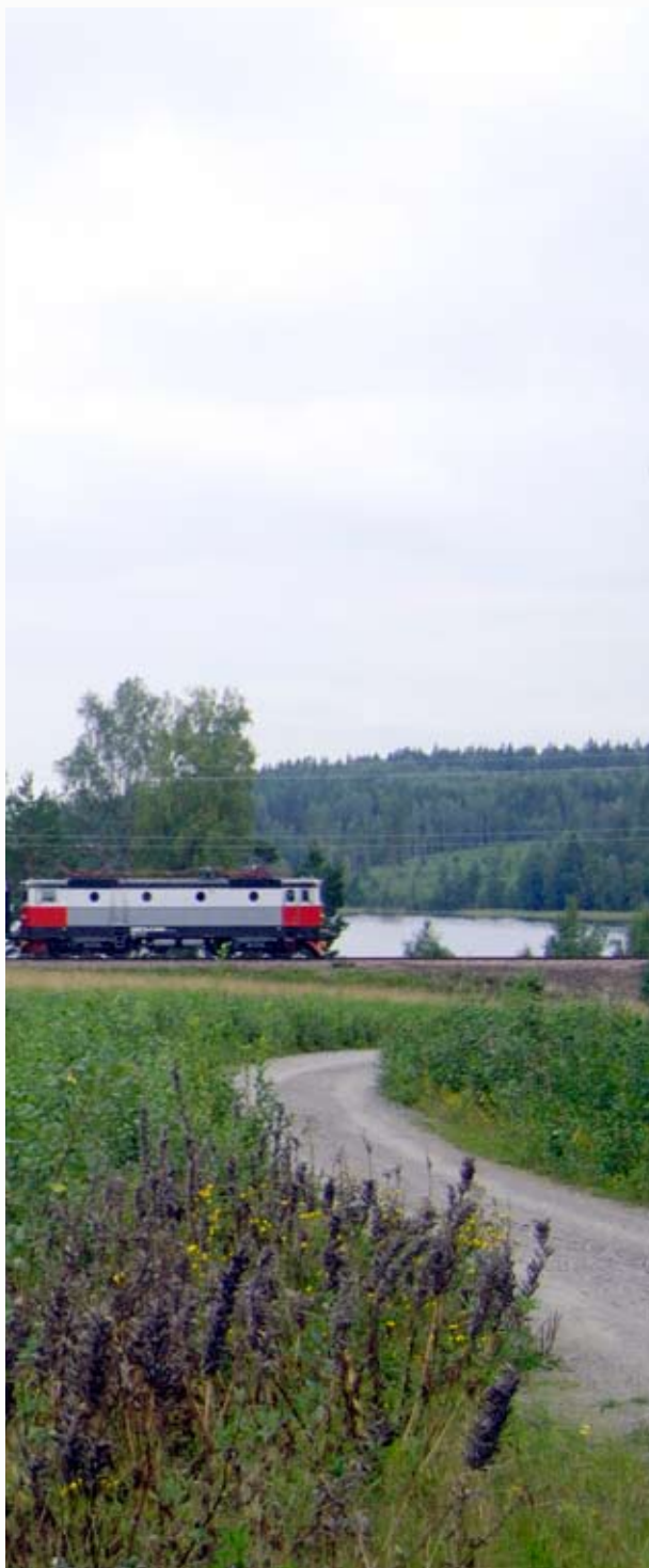
Ett av Statens järnvägars Rc3-lok vid Gunnarsbyn