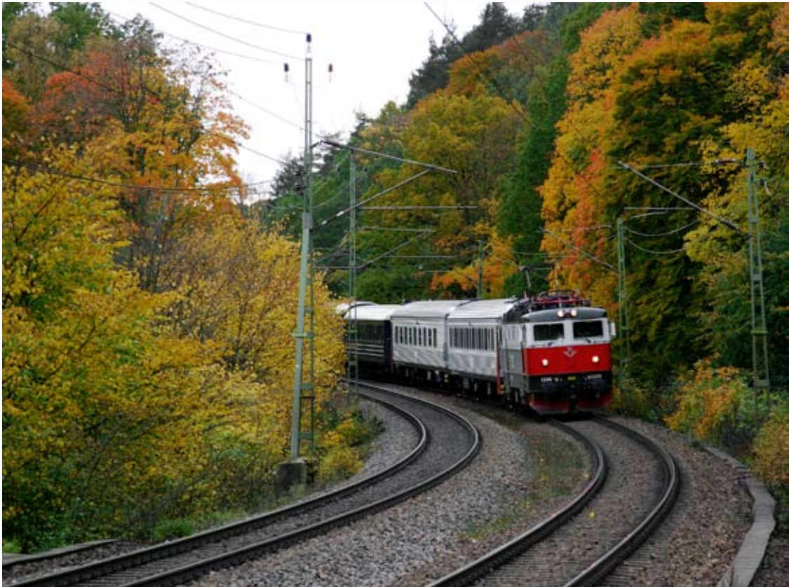
Nattåget mellan Göteborg och Narvik i närheten av Jonsered