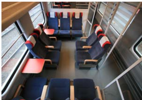
Sällskapsutrymme i upprustad sittvagn 2-klass (littera B9)