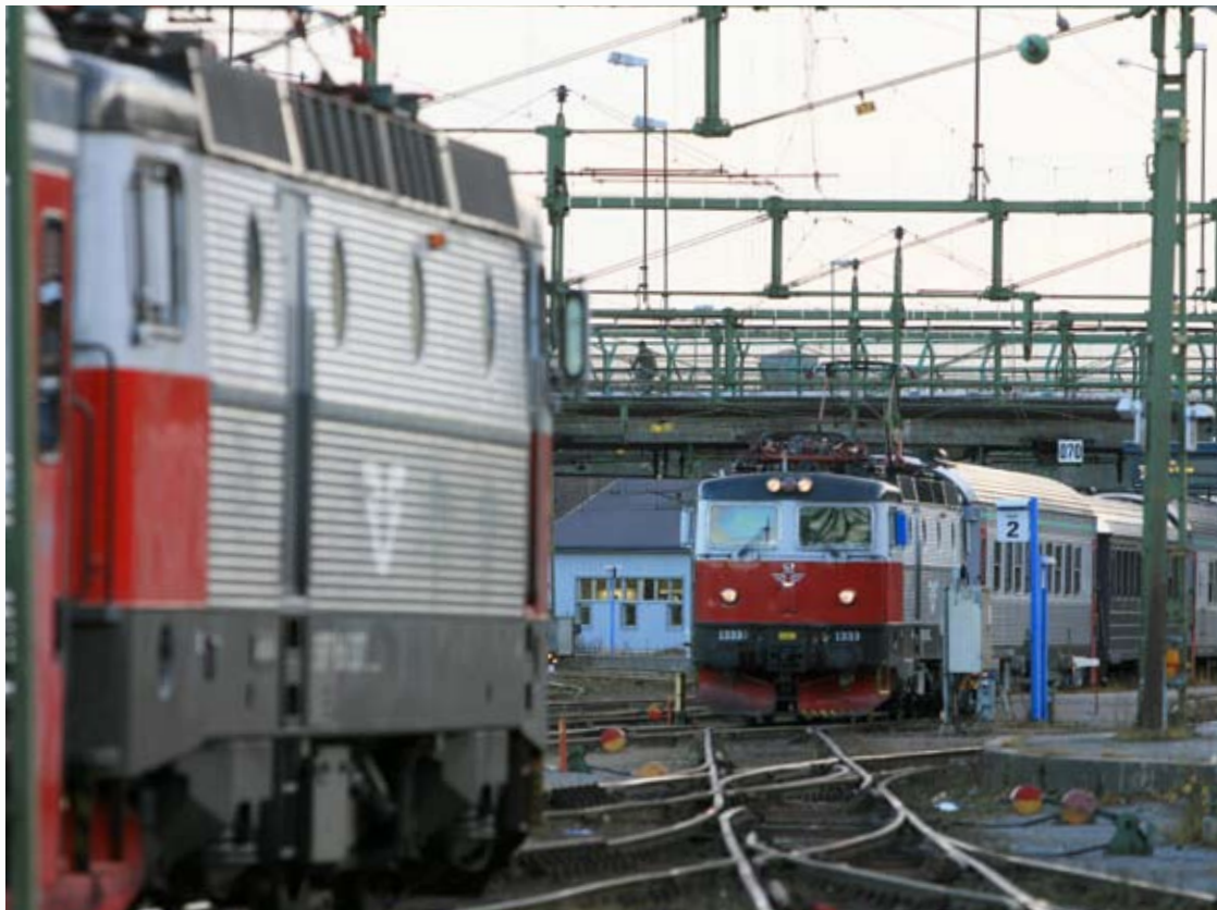
Nattåg i "Norrandstrafiken" på Luleå station